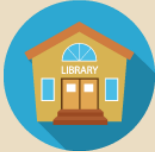
Okul İle İlgili Sorunlar